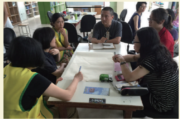
宜蘭場中親子共學團家長正討論共學團的想望如何兼顧生計的運作模式。