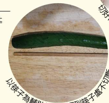
以筷子為輔助擋片，切到筷子處不切斷