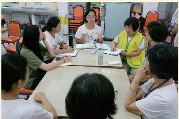
龍潭地區營運委員會討論如何共同營運，把龍潭團隊帶向更好的遠景，一起合作找幸福。