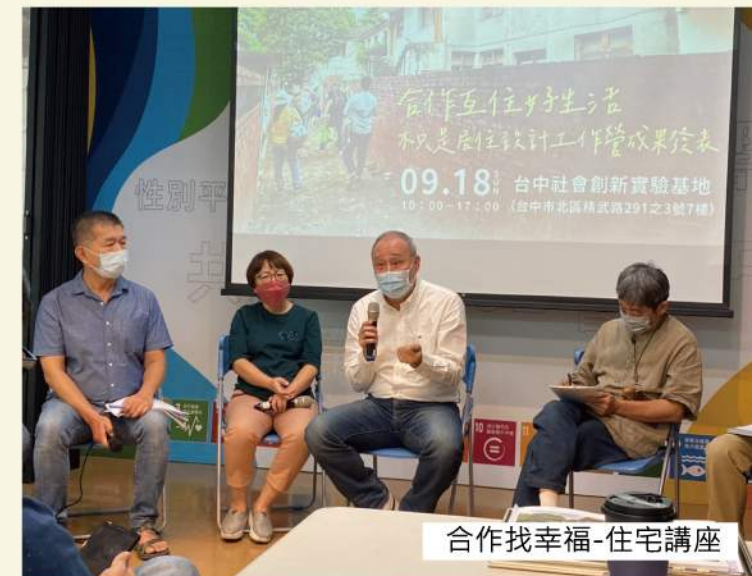
合作找幸福-住宅講座

從2012年至今，合作找幸福已舉辦十個年頭，不僅催生了許多合作社，也和外部團體有了更多的社間合作，從2020年與東海大學社會系合辦研討會開始，2021年起結合了更多外部組織，有OURs專業者都市改革組織、台灣勞工陣線協會、逢甲大學、