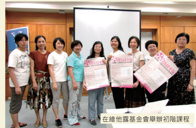
在維他露基金會舉辦初階課程

第二天課程，上午由泰雅族導覽員帶領大家走訪達觀部落的景觀，瞭解泰雅族文化。下午由