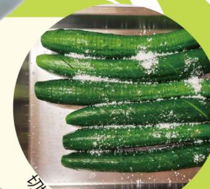
切好的小黃瓜放入鹽巴醃軟