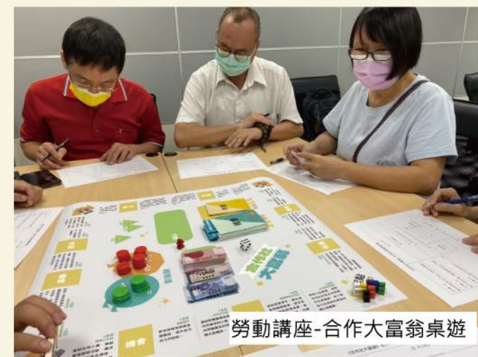
勞動講座-合作大富翁桌遊

眉溪儲蓄互助社.....等，2022年OURs、勞陣繼續合作，又加入了花園城市協會及伯拉罕照顧共生勞動合作社。引起的迴響和討論，一年比一年擴大。當我們為理想而聚首，就已經感受到滿滿的幸福滋味。