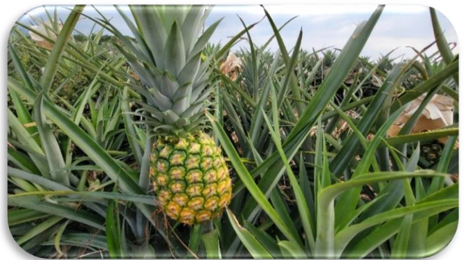
金香鳳梨外觀討喜可愛，香氣濃郁，果肉金黃，香甜不咬舌，風味極佳！