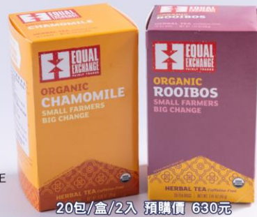
EQUAL EXCHANGE 有機甘菊茶