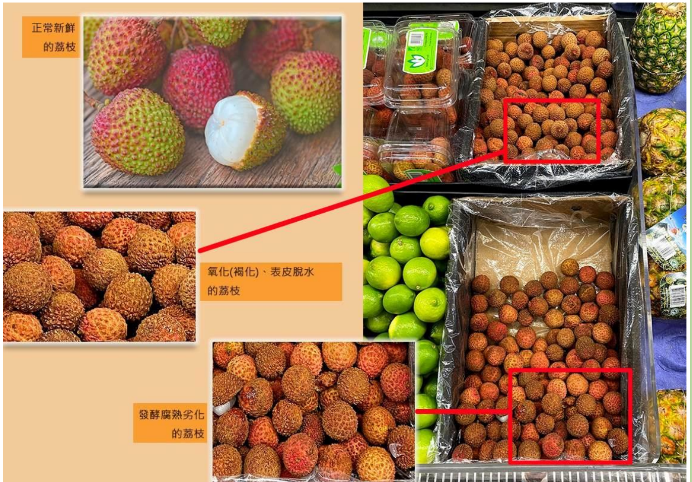
▲荔枝新鮮與否的判定。市售荔枝保存環境不佳，常常導致荔枝脫水褐變，甚至發酵。