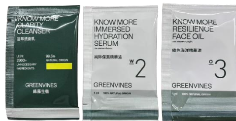
清潔保養試用組為： 活萃洗面乳 1ml、純粹保潔精華液 1ml、綠色海洋精華油 1ml