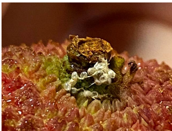
▲荔枝細蛾 (蒂頭蟲) 的蟲卵

荔枝細蛾 (Conopomorpha sinensis Bradley, Litchi borer) 的幼蟲俗稱蒂蛀蟲或蒂頭蟲，是令荔枝農友頭痛的害蟲。牠們常常躲在荔枝蒂頭，讓人在剝開荔枝預備享用時不經意現身，以致驚嚇不已。為了避免影響銷售，慣行農友只得使用農藥防治。合作社供貨的農友致力減藥或有機栽培，雖已盡力篩選果實，但仍難免有漏網之蟲。還請社員理解後再利用。