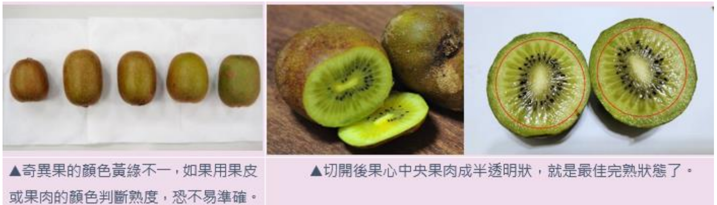
▲奇異果的顏色黃綠不一，如果用果皮或果肉的顏色判斷熟度，恐不易準確。