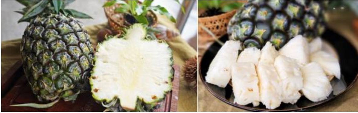
▲牛奶鳳梨外皮雖是綠色，其實果肉已熟成，購買當天即可食用。果肉雪白細緻、香甜不咬舌，風味極佳！