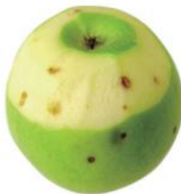
圖. 苦痘症青龍蘋果削皮後外觀