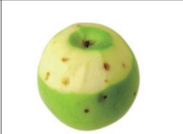
圖. 苦痘症青龍蘋果削皮後外觀