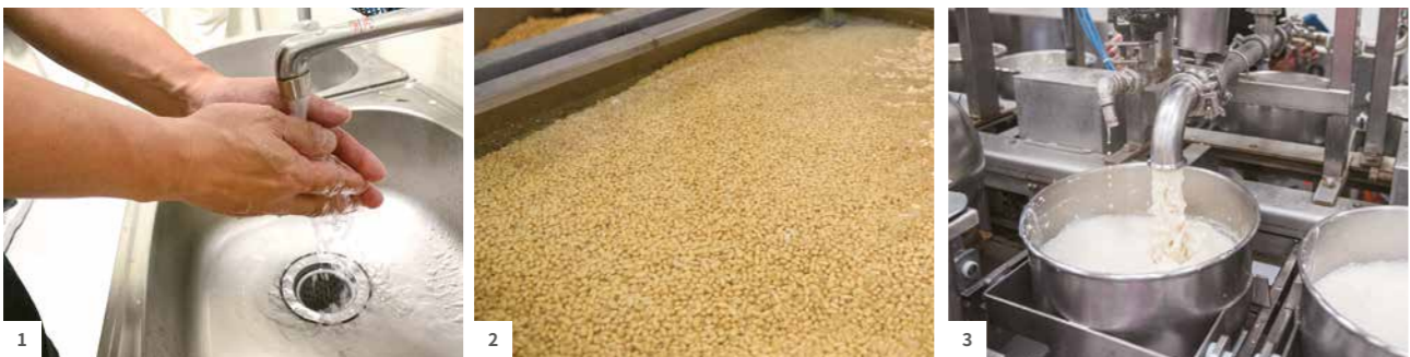
1 工作人員進廠前以清潔液徹底清潔手部，擦乾後再噴灑酒精消毒。2 製作豆漿前一天需先倒入豆子，設定自動注水，視冬夏日氣溫不同以常溫浸泡 4 至 9 小時，隔天機器自動排水，方可開始製作。3 豆腐製作的源頭；豆漿和凝固劑混和後，一管灌入豆漿、一管灌入凝固劑，以電子機台控制秒數，依當天豆子狀況微調灌入時間。

2000 年，茶月商行正式登記，創始初期虧損連年。陳勝泉和弟弟在嘉義東市場擺過攤，