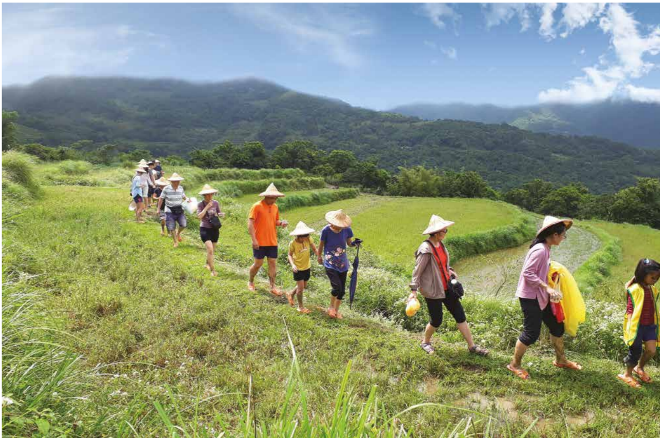
參加踏察活動的社員換上指定拖鞋到休耕的水梯田巡看，此舉可避免外地鞋子帶來的汙染。