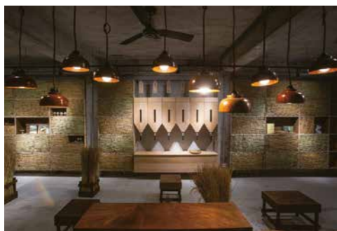
社會企業「狸和禾小穀倉」位於貢寮老街，販售人與生物共存的理念。