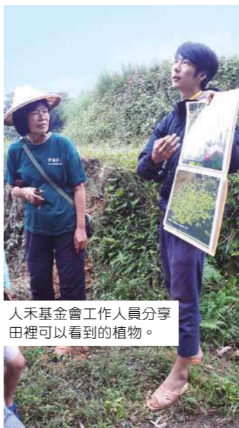
人禾基金會工作人員分享田裡可以看到的植物。

目前在地組成的「和禾生產班」，班員需遵守友善環境作業規範，田區不使用農藥、除草劑；順應田區乘載不使用大型農機，維持梯田穩固也降低農機運轉傷害土壤裡的生物，且盡