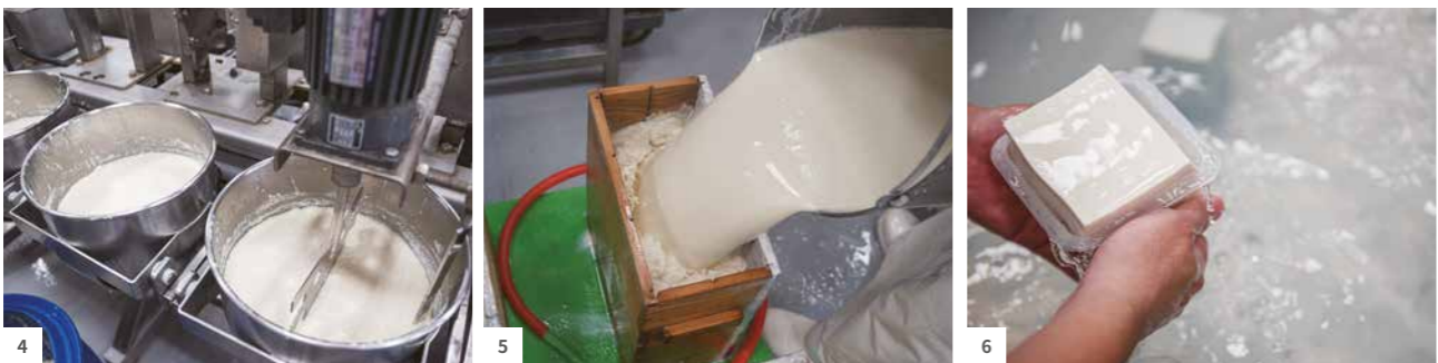
4 製作豆干過程需進行「破花」，把已經凝固成形的豆腐腦打散，方便壓出水分。5 茶月生產管理部主任洪子喬說，18 罐豆漿可做出約 30 塊絹豆腐，為保持內部及表面光滑細緻，採日式作法以手工灌入木頭模具，讓泡泡自然溢出。6 切塊的絹豆腐，置入冷水中冰鎮定型後再裝盒。

也進貨到嘉義在地連鎖超市，銷售都不好；台南日系百貨開業，受邀進駐開設專櫃的頭 5 年也是慘澹經營，直到食安風暴襲捲引發消費者關注，才出現轉機。2010 年初，一連串與豆製品有關的食安事件，如市售豆干驗出防腐劑過量、豆干引發肉毒桿菌中毒、豆製品驗出苯甲酸超標，2011 年爆發塑化劑汙染食品，2013 年毒澱粉事件等，食安問題層出不窮，也讓茶月的業績逆勢成長。