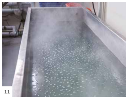
7 每個製作豆干的不鏽鋼盤約重 12 公斤，相當於 12 罐豆漿的重量。8 為了不使用消泡劑，設專人手工撈泡。9 豆干製作完成後，工作人員再次檢查是否有小塊凝固的豆皮或混入異物。10 豆漿裝瓶自動化。11 所有產品完成包裝後，置入此區後殺菌處理池以巴氏殺菌法殺菌 30 分鐘，送入冰水循環池冷卻，再冷藏儲存。

凝結，泡泡會浮在上面再手工撈掉。」現在改為自動製漿，依然有工作人員負責手工撈泡。