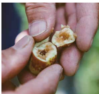
東方果實蠅會產卵於果實中，是紅棗主要的害蟲之一。