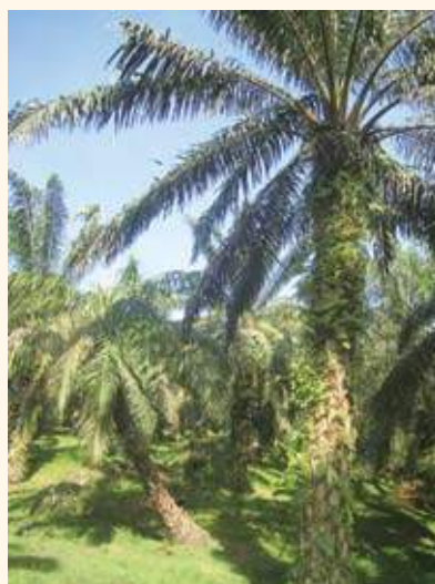
跨國企業的大型種植園砍伐雨林、耗費水資源，破壞生態平衡。