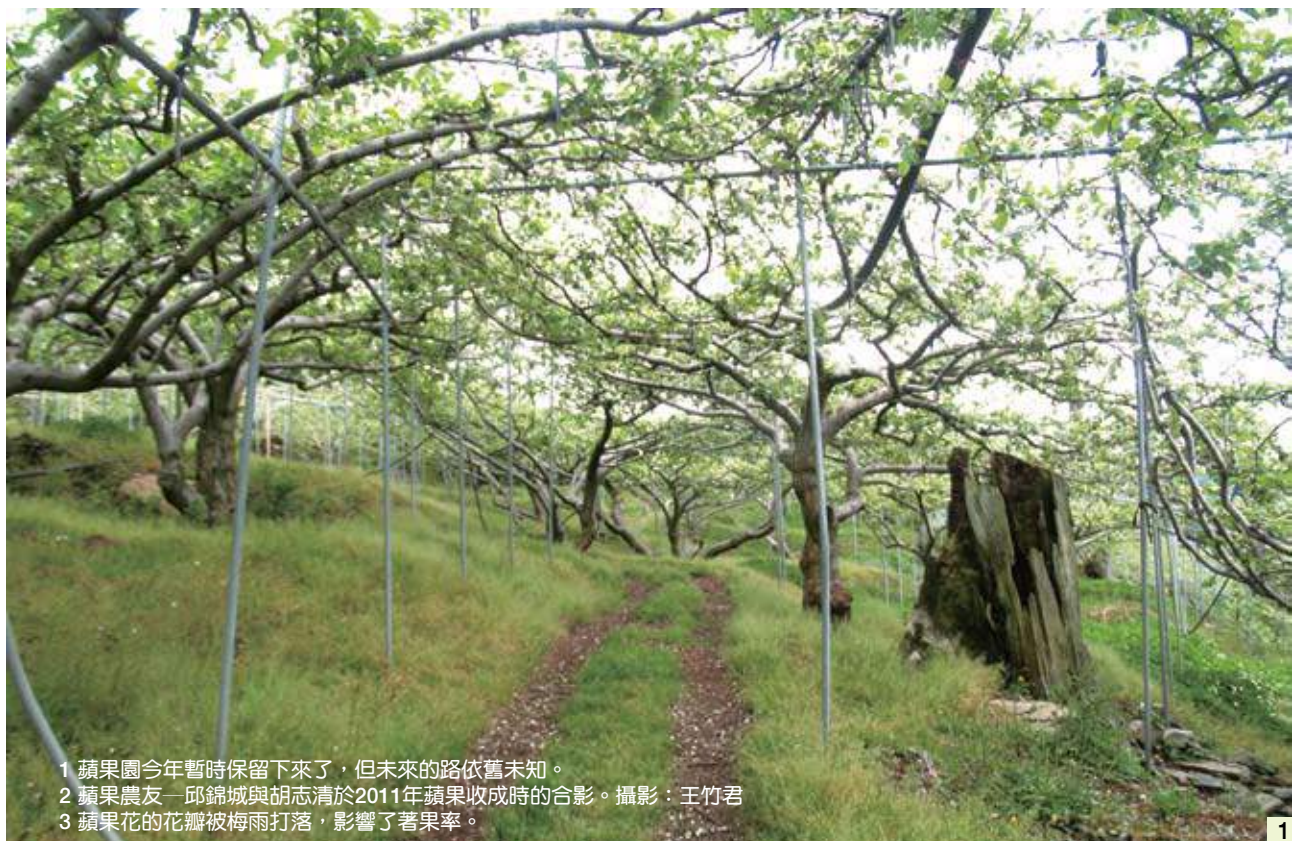
1 蘋果園今年暫時保留下來了，但未來的路依舊未知。 2 蘋果農友—邱錦城與胡志清於2011年蘋果收成時的合影。3 蘋果花的花瓣被梅雨打落，影響了著果率。

大禹嶺地區總共有二百多公頃的果園，完全是退輔會的榮民們開墾出來的，相較梨山地區近二千多公頃的開發