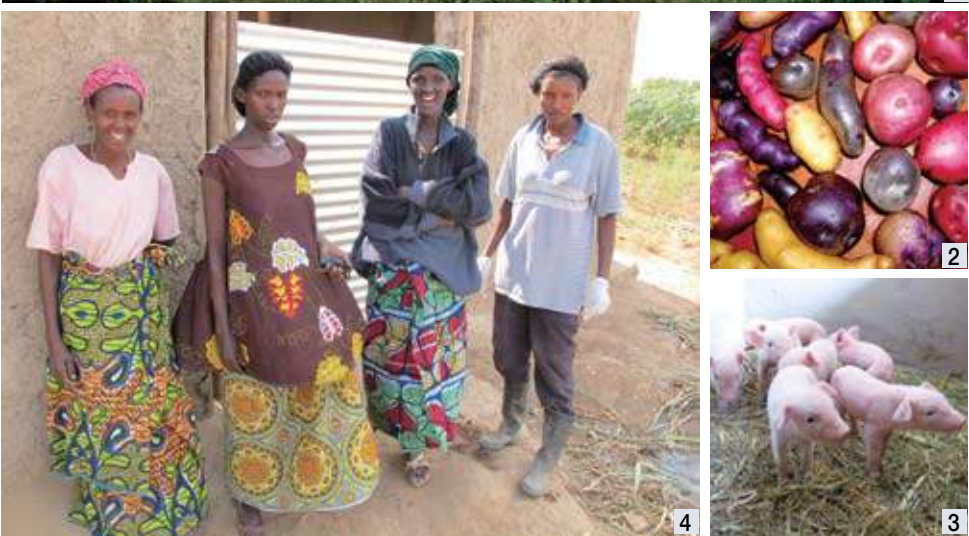
1~2 安地斯山區是馬鈴薯的故鄉，Cauqueva合作社正努力拯救這裡幾千種的馬鈴薯品種。 3 當年由7隻小豬開始，如今養豬已經成為婦女社員們的替代生計來源。 4 這些盧安達婦女彼此扶持，成功走出歷史的悲情。