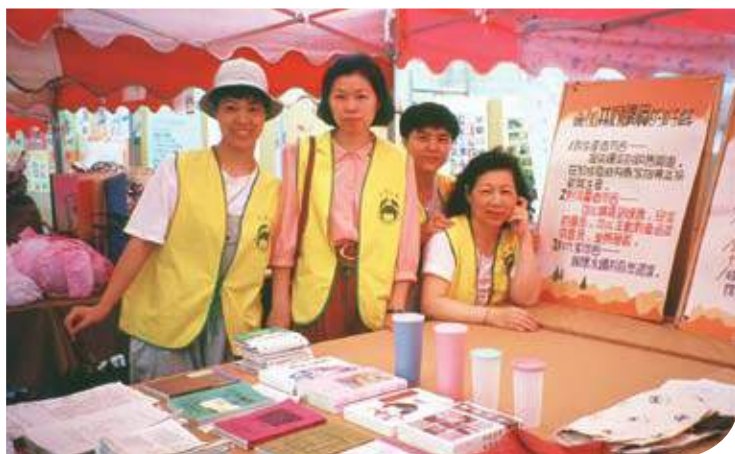
當年主婦聯盟基金會在推廣共同購買理念時晏子亦不遺餘力。