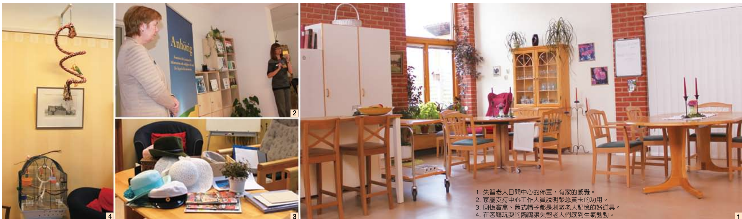
1. 失智老人日間中心的佈置，有家的感覺。 2. 家屬支持中心工作人員說明緊急黃卡的功用。 3. 回憶寶盒、舊式帽子都是刺激老人記憶的好道具。 4. 在客廳玩耍的鸚鵡讓失智老人們感到生氣勃勃。

最令人感動的是，家屬支持中心的工作人員說：「家屬的照顧是自願，而非義務！」我們常認為這樣的觀念不適合崇尚孝道的台灣社會，但事實上，許多台灣老人缺乏良好的照顧，孤獨感也很高。相較於瑞典，家屬照顧不是義務卻很少將老病完全棄之不管。當國家承擔起繁重的照顧工作，才能讓家屬更投入情感支持及生活中的照顧，並且家屬是在有政府支持的情形下自願照顧。這都是值得我們學習的。（作者：瑞典隆德大學社會學博士、高師大性別教育研究所助理教授、著有《台灣女生 瑞典樂活》）