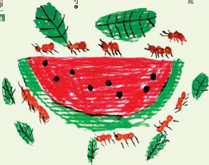
「瓜庭綿綿·重返灣寶遊樂會」寫生比賽第一名「西瓜獎」之作品。