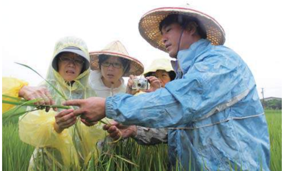
▲如何分辨稗草和稻草？大家認真學習。