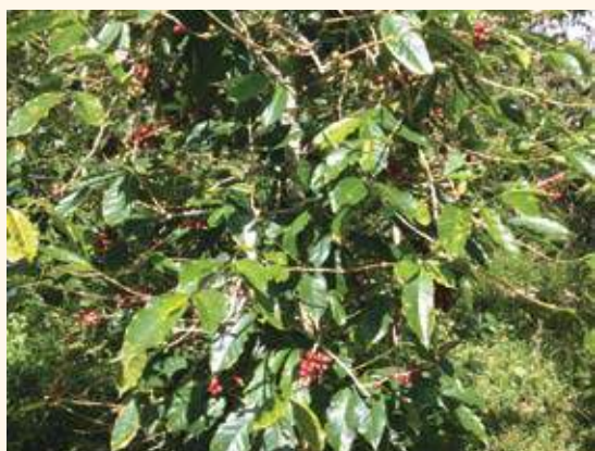
上：教育仍是脫貧的最佳途徑，雨林咖啡的社區回饋有相當比例用於提供獎學金、小學教科書以及樂器，圖為今年受贈樂器的村落小學。 中：雨林咖啡協助村落建置給水設施。 下：雨林咖啡契作的農戶採取友善環境的樹蔭栽培，果樹、咖啡樹和豆科喬木共生，減緩熱帶雨林的消逝。