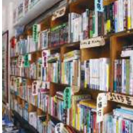
逛了一圈書架子，舉出了一些紙牌，手寫著書的分類，特別多談臺灣文化，連書名似乎只在圖書館裡才能看到。