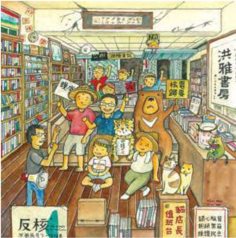
繪畫 | 徐佳伶/ 阿甲

2015年台灣獨立書店文化協會獲得文化部的補助，籌辦書店風景巡迴展，由徐佳伶繪製30間書店的風景，自2015年6月6日至9月26日於四家書店巡迴，7月將於洪雅書房展覽。鼓勵人們拜訪、支持全臺灣各地的獨立書店，活動期間也提供書店風景護照供旅人蓋上紀念章戳。