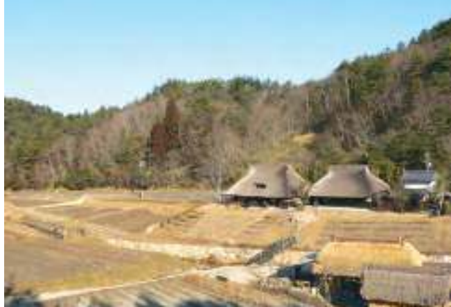
2007年余國信參訪日本京都、滋賀的秀明自然農法，當地整體思考生活的各方面，自然民居如合掌屋、民俗、藝術、畜牧、養殖漁業等都在同一個村落裡。