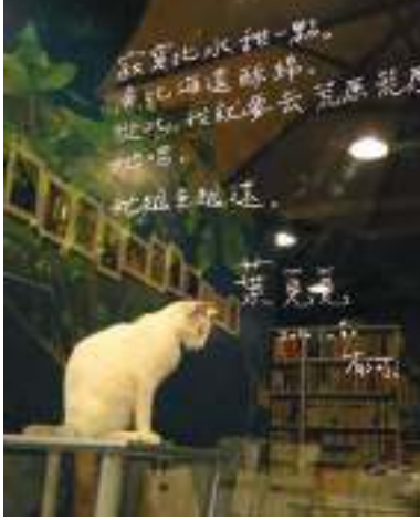
有河book書店位於淡水河畔，店內販售書籍外，還附設咖啡吧，不定期舉辦的電影播放、讀詩會。