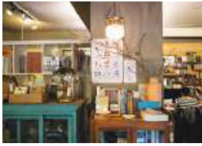
註書店不只是書店，還有其他服務項目，連結以書為中心的文化脈絡。