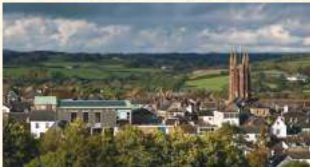
市政廳上的太陽能板，在古樸的英國小鎮裡，閃閃發亮。