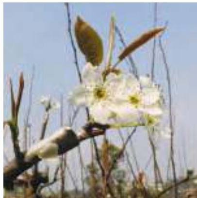
遠渡重洋的溫帶梨穗花苞，經過移花接木的巧手，正盛開著。