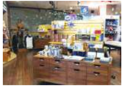
水木書苑經營28年，為愛書人提供多樣選擇與服務，讓讀者不只是狹隘的讀書人，而是博學的通識之才。

過程中意識到公司受制於現實的困境，較難發揮公益的功能。於是，以獨立書店聯盟的書店為基礎，為了推廣獨立書店文化，又成立了台灣獨立書店文化協會。