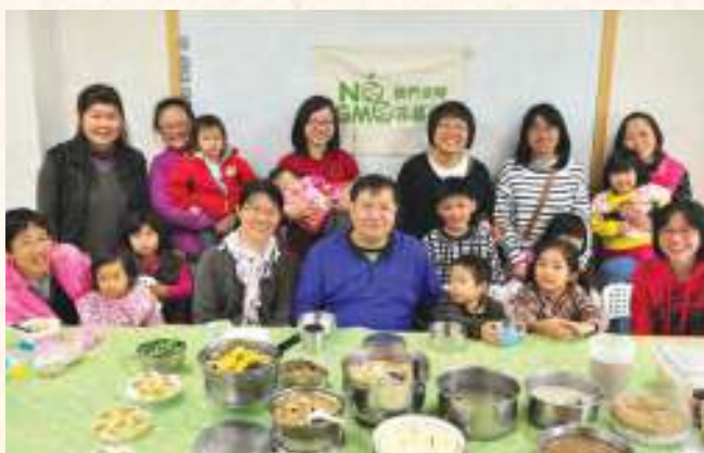
《真食育》介紹了臺中三民站的親子聚會。社員們一家一菜，共煮共食共學。

己的手藝，於是，那段時間是我人生體重最重的日子。現在編完了這本基金會與合作社共同策劃的《真食育》一書，倒也不是擔心又要發胖，而是再次體會到「吃飯皇帝大」、「民以食為天」的精要義理。一天三餐，真是太重了：土地、農業、健康、環境、能源、親子互動、添加物、非基改……食物牽連的層面多麼廣、多麼深，卻又那麼生活、那麼日常。「好好吃飯，就是好好生活」，這是我從書中這些實踐食育不遺餘力的媽媽們身上，學到的最受用的一課。