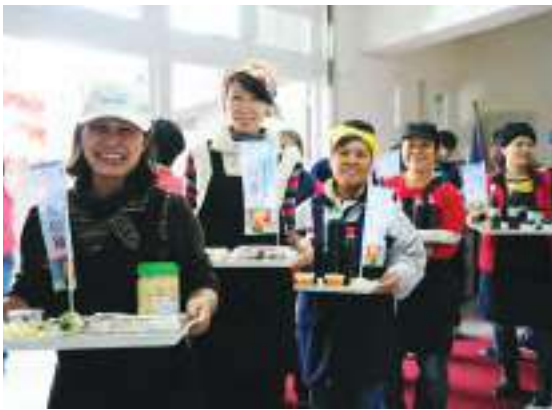
2013年彰化縣政府執行「儲蓄互助培力—平民銀行」專案成果發表會，其中活動為創業媽媽上菜秀。