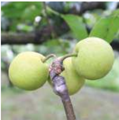
使用石蠟紙接穗的技法較為環保，石蠟紙可以在泥土中自然分解。另外，果梗乾淨而沒有塗抹賀爾蒙的透明膠水痕跡，也是友善的耕作方法。