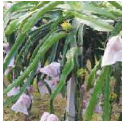
火龍果具有多重花期的特性，照片上有的火龍果已經套袋轉紅準備採收，有的火龍果是剛著果的綠色小果。