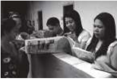
文·攝影 | 謝三泰

高雄楠梓加工區的移工宿舍裡，菲律賓籍移工們在工作閒暇之餘，藉著閱讀報紙刊物，了解家鄉的新聞，同時也增加對臺灣生活文化的認識，並彼此開心分享閱讀後的心得。