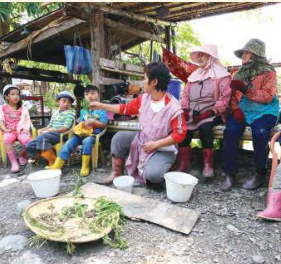
部落長輩教孩子認識田野中的草葉植物。

二〇一五年五月十五日那天，正當我在臺北參加二〇一五年台灣社會福利學會年會「從社會福利觀點看全球風險、國家治理、與在地照顧」時，聽說《長期照顧服務法》通過了。然而，《長期照顧服務法》財源未定，亦未明確排除由營利機構來經營的可能性。在探討法令之前，我想先講個在地老化的夢想。