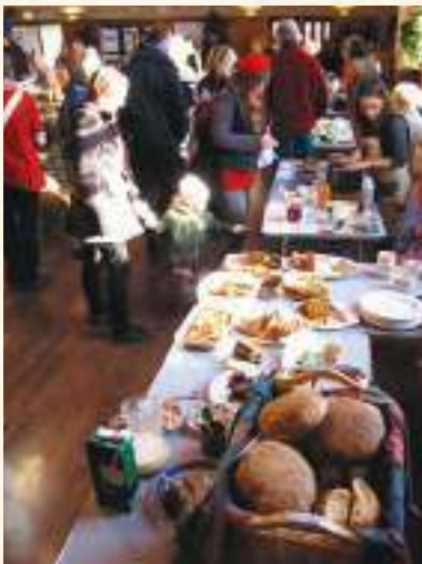
在市政廳舉行的冬日盛典，鎮民拿自己做的麵包、發酵品、草藥與其他人交流。

主題工作坊，由T T T的九個工作小組負責主持相關主題（如食物、教育、在地生物多樣性、能源、健康與福祉、內在轉化、生態建築、綠色運輸、在地經濟）的討論，最後匯集參與民眾對每個主題的未來想像（五）。工作坊結束後，E D A P核心團隊收集所有九個主題資料，按照時間序列整理出所有的參與意見，公布在市政廳，同時舉辦「二〇三〇歌舞秀」，吸引鎮民前來觀看整理後的成果並順道一起同歡（六）。