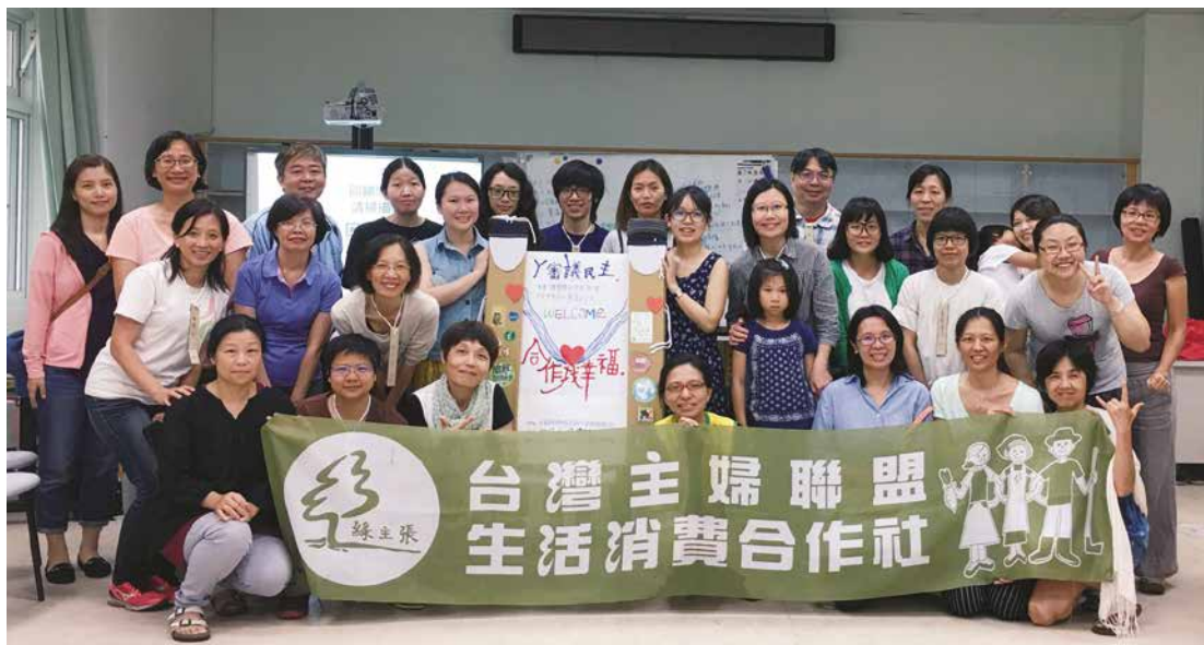
感謝所有夥伴一起參與，明年再一起合作找幸福！

二〇一六年宜蘭場「合作找幸福」，一開始即定調為培力在地社員及理念相同的夥伴組織投入合作運動。因此，宜蘭地區營運與宜蘭共學團成員，在兩場初、進階工作坊之後，決定共同攜手，籌組「合作·共學」小組，除了定期開會，持續深化合作經濟在宜蘭的推動及實踐，對於二〇一七「合作找幸福」的規劃，期望從實務面著手，企圖解決合作組織運作所面臨的問題切入。