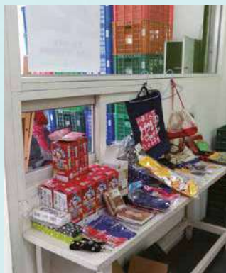
社員們捐出家中不用的物品，提供站所義賣，所得捐贈至臺灣水資源保護聯盟。

接下來是地區營運委員會會務報告，費心準備好的簡報檔案當然也無法派上用場了，幸好大家臨危不亂繼續留在座位上，在暗淡的光線中，可愛的社員們一邊搖著手邊的紙張散熱，一邊聽我口頭報告南門站社務。主題訂為「合作真幸福」的內容包括：地區