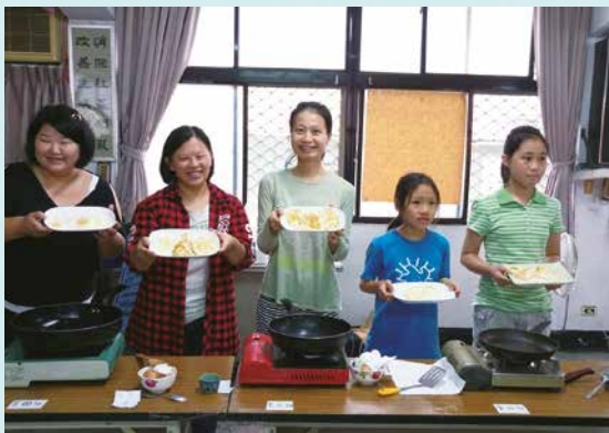
煎荷包蛋比賽限定社員及眷屬報名參加，不分年齡展現好技巧。