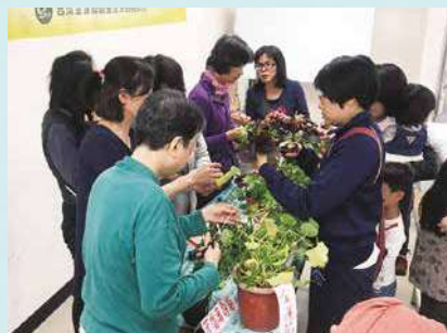
與景美區推動「綠簾子」結合，年會活動也安排植物扦插的教作。