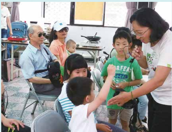
當天講述繪本故事「想生金蛋的母雞」，傳遞人道飼養蛋雞的觀念，與大小朋友熱鬧互動。