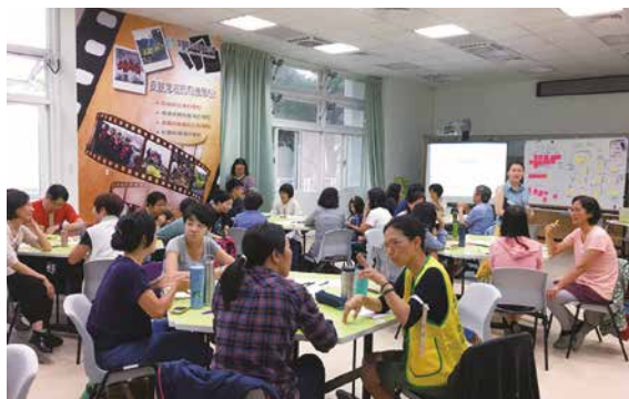
兩人一組「你聽我說」，學習如何積極聆聽？

說理、形成結論」的程序原則，開啟對話。對話與溝通不是為了說服、而是為了互相理解、求同存異。