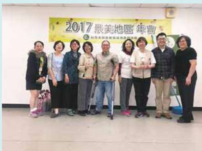
完成這次不可能任務的背後推手—地區營運全體夥伴們。

跨出了這重要一步之後，感覺到地區營運委員們與站務團隊因為這次年會的合作而更加緊密了，彼此熟絡如家人般溫暖互動。未來希望朝「社區柑仔店全方位服務」的方向努力經營社員與社區，亦相信「景美站」一定會愈來愈好！