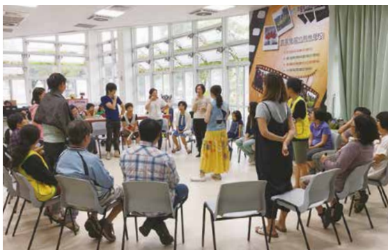
審議民主的「大風吹」怎麼玩？

一整天的工作坊，為合作社的民主操作打開了另一扇窗。對於我們所「共有」的合作組織，在社員平等參與的過程，如何融入審議民主的精神？讓更多人願意聆聽、參詳（臺語），透過「知情討論、互相