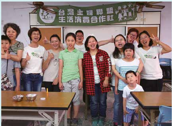
在地區營運夥伴及分社組織課的通力合作下完成輕鬆有趣的社員大會。