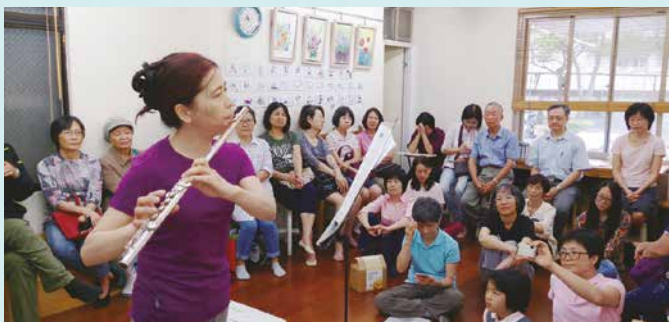
大家陶醉在悠揚的樂音中，心中滿滿感動。

士林區營運委員會，於三月會議決議年會的內容除了運作準則規定的報告年度社、業務情形、社務計畫與預決算之外，還包括手繪彩色畫卡贈送、社員分享音樂會、委員及各委員會運作介紹，以及互動時段的有獎徵答和茶點時間。希望透過這樣的活動設計，在溫暖氣氛中，帶給社員知性與感性的饗宴。